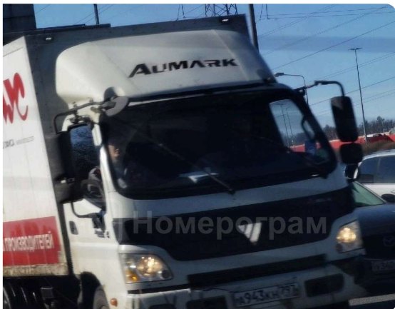
Фото автомобилей с госномером H340YC750

Госномер: ..... H340YC750 VIN: ..... XWEJ381EBL0000193 Год производства: ..... 2019 Категория ТС: ..... В Руль: ..... Левый Цвет: ..... Бежевый Модель двигателя: ..... G4FG Тип двигателя: ..... Бензиновый Номер двигателя: ..... КН866607 Мощность: ..... 124 л. с. / 91 кВт Объем двигателя: ..... 1 591 куб. см Дубликат ПТС: ..... Не выдавался Тип ПТС: ..... Бумажный