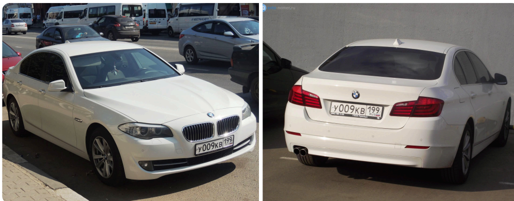
Фото автомобилей с госномером У009КВ199

Госномер: ..... У009КВ199 (неактуальный) VIN: ..... WBA5A31050G300608 Год производства: ..... 2015 Категория ТС: ..... В Руль: ..... Левый Цвет: ..... Серый Модель двигателя: ..... Т20I20I Тип двигателя: ..... Бензиновый Номер двигателя: ..... В2971211 Мощность: ..... 184 л. с. / 135.3 кВт Объем двигателя: ..... 1 997 куб. см Дубликат ПТС: ..... Не выдавался Номер ПТС ..... 77УР850574 Тип ПТС: ..... Бумажный Номер СТС: ..... 77 36 № 888951